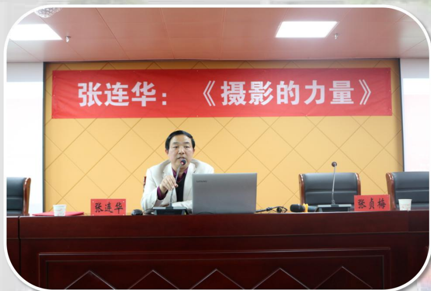
“禹风大讲堂”第十五期——《摄影的力量》